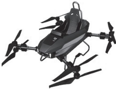
Vue de 3/4 face

50135-001-001 Un modèle de véhicule volant (drone) «MC1»