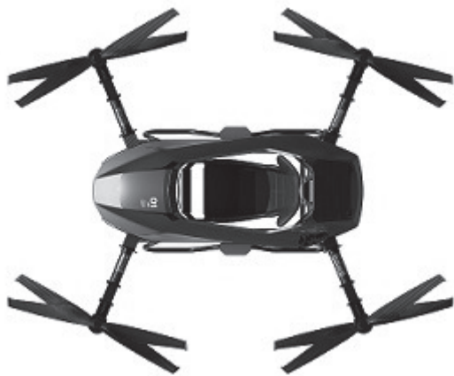
Vue de haut

Par : Monsieur Erwan GRIMAUD 4, rue des Ligures 98000 MONACO (PRINCIPAUTE DE MONACO)